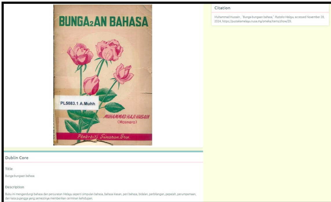
Gambar 2. Sampel rekod bibliografi buku 1