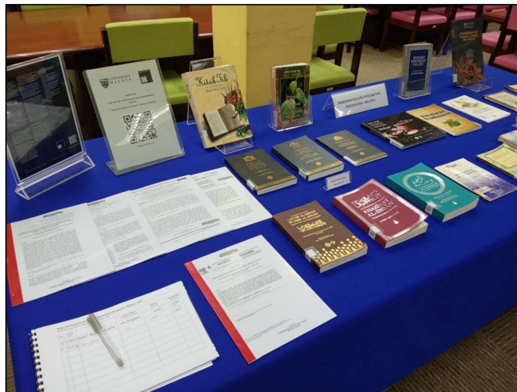
Gambar 2: Koleksi yang dipamerkan