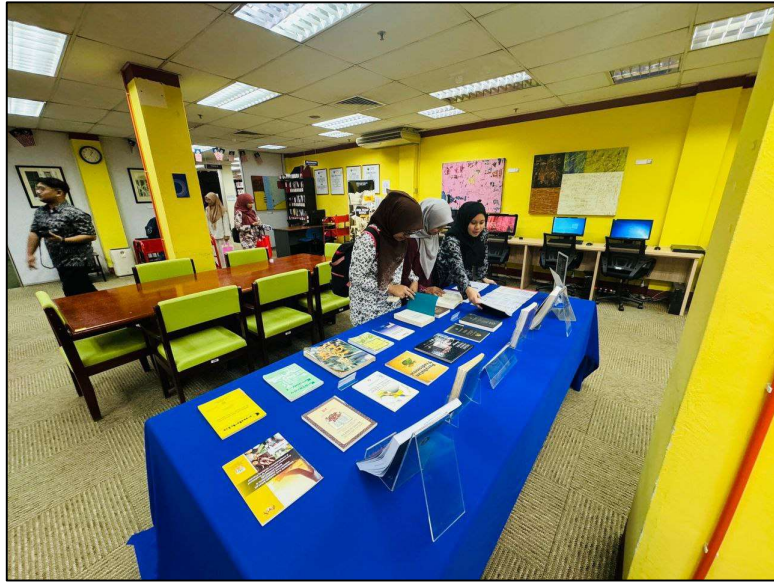
Gambar 3: pelawat melawat pameran