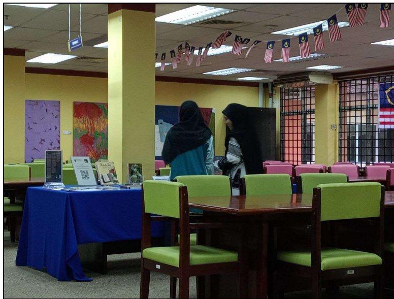
Gambar 4: Pelajar melawat pameran