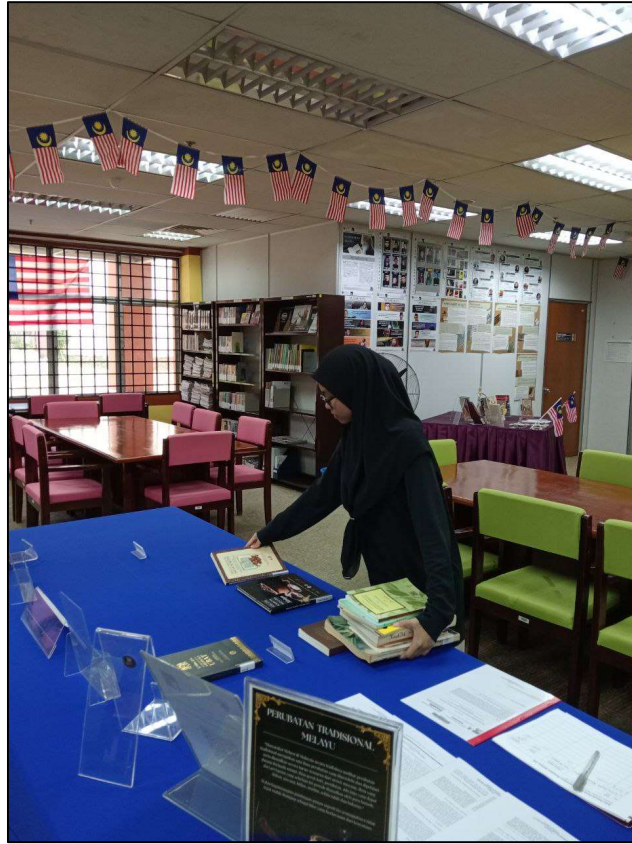
Gambar 1: proses penyusunan koleksi di meja pameran